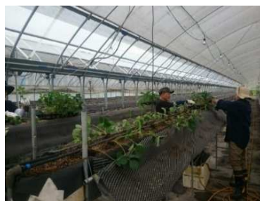
いちご農家での定植補助作業