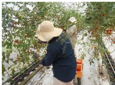
トマト農家での収穫・片づけ作業

農家さんとコミュニケーションをとりながら現場で実践！園芸の教科書では学べない実際のところを知る機会になります！