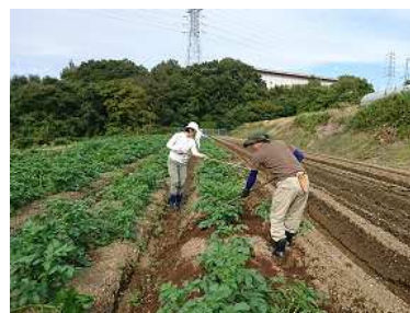
じゃがいもの芽かき・土寄せ作業